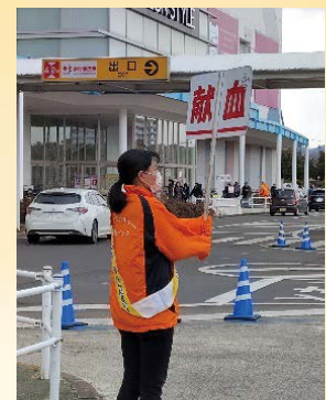
<イオンモール名取> まずは、献血の呼びかけから