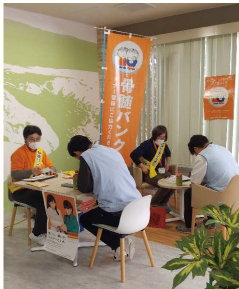
<ソニーセミコンダクタマニュファクチャリング(株)白石蔵王 TEC>