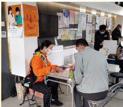
<仙台市青葉区役所>