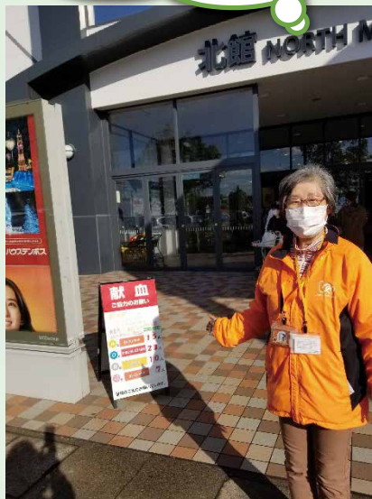
イオンモール新利府北館