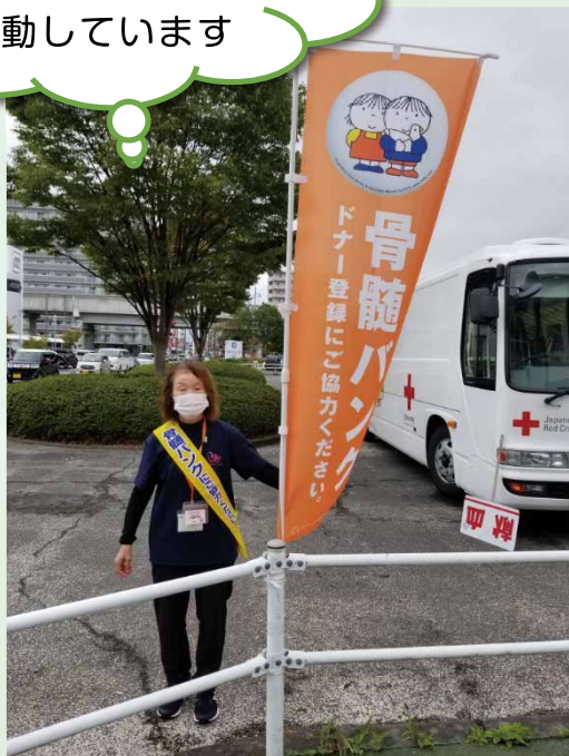
イオンモール名取